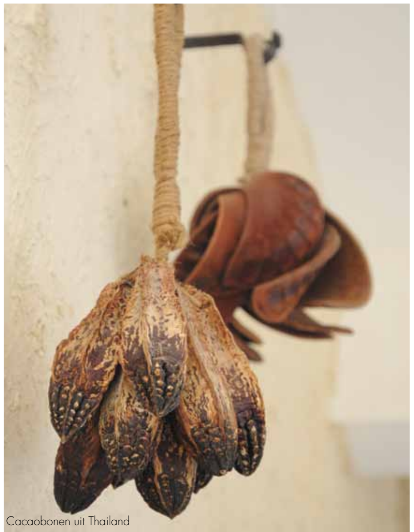
Cacaobonen uit Thailand