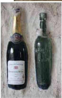
De voormalige garage kreeg een licht interieur met opvallende details, zoals de in de muur gemetselde wijnflessen