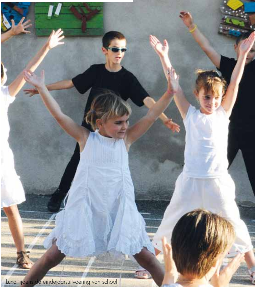
Luna tijdens de eindejaarsuitvoering van school