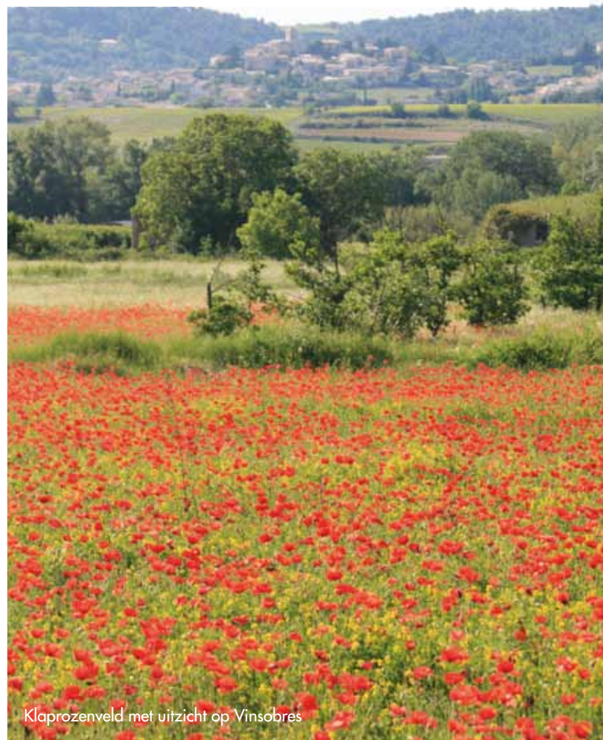
Klaprozeveld met uitzicht op Vinsobres